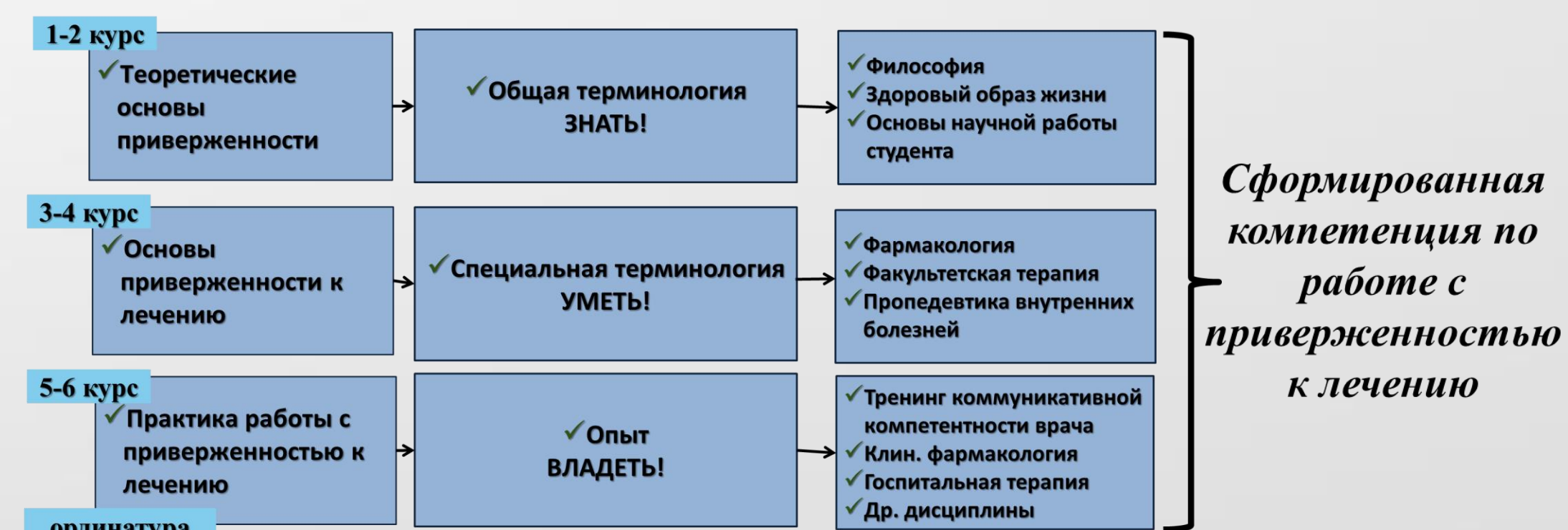
Рис. 1. Траектория формирования компетенции будущих врачей по работе с приверженностью к лечению